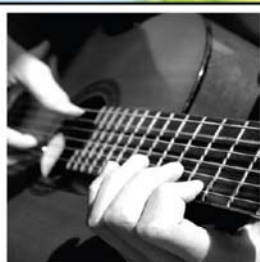
CORSO DI CHITARRA: CLASSICA ELETTRICA ACUSTICA