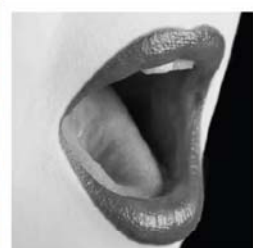
CORSO DI CANTO LIRICO