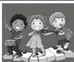
GIOCHI MUSICALI CORSO PROPEDEUTICO in collaborazione con: