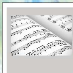
CORSO DI TEORIA MUSICALE