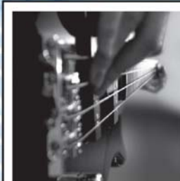
CORSO DI BASSO ELETTRICO E CONTRABASSO