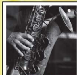
CORSO DI SAXOFONO