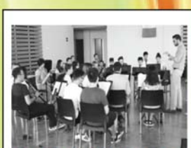
MUSICA D'INSIEME LABORATORI