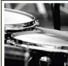
CORSO DI PERCUSSIONI