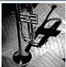
CORSO DI TROMBA

“Riccardo Mosca” Inizio corsi ottobre 2021