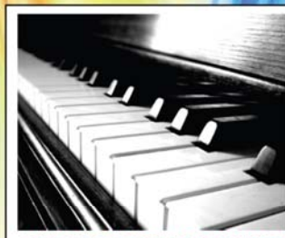
CORSO DI PIANOFORTE