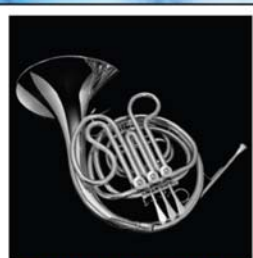
CORSO DI CORNO