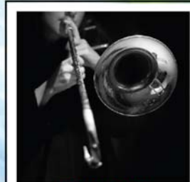
CORSO DI TROMBONE E OTTONI GRAVI