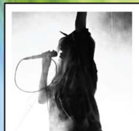
CORSO DI CANTO MODERNO