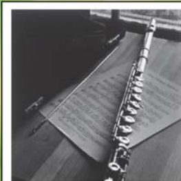
CORSO DI FLAUTO