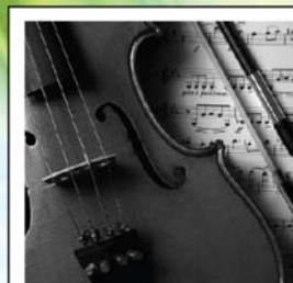
CORSO DI VIOLINO